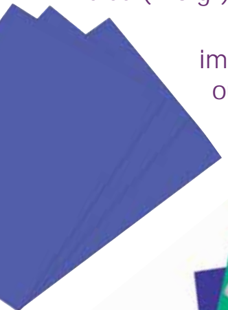
imprimante ou papier calque