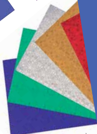
papier épais argent étoilé